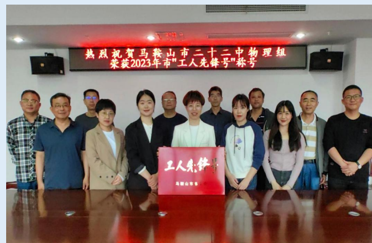
物理组获“工人先锋队”称号

学校现有42个教学班，在校学生近2200人。现有教职工154人，专任教师150人。其中，正高级教师2人，高级教师71人，省特级教师2人，省学术和技术带头人1人，享受省政府特殊津贴1人，全国巾帼建功标兵1人，省优秀教师3人，省劳动模范1人，市学科带头人2人，市骨干教师12人，市教坛新星2人。